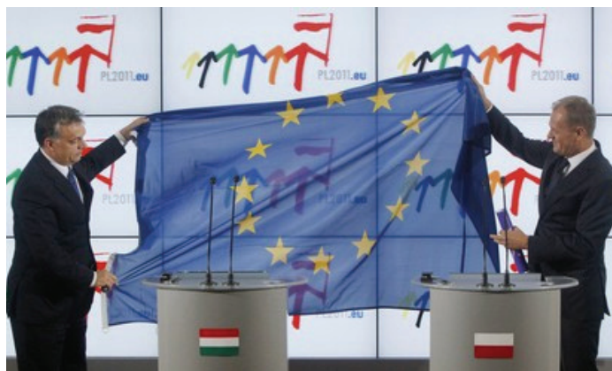
Maďarský predseda vlády Viktor Orbán (vľavo) symbolicky odovzdáva rotujúce predsedníctvo v Rade EÚ predsedovi poľskej vlády Donaldovi Tuskov (vpravo) v júli vo Varšave.

Dôkazom, že V4 sa naozaj angažuje v krajinách VP, je aj usporiadanie dvojročného summitu VP, ktorý sa uskutočnil v závere septembra v Poľsku. Zúčastnili sa na ňom lídri 33 krajín, ale aj vrcholoví predstavitelia EÚ – Herman Van Rompuy, predseda Európskeho parlamentu Jerzy Buzek či predseda Európskej komisie José Manuel Barroso.