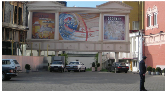
Gruzínsko, súčasťou Európy? Nápis v Batumi, gruzinskom prístavnom meste na Čiernom mori, prístav kolchidskeho kráľovstva z gréckej mytológie, domov Médey a cieľ Jásona a Argonautov

Potrebuje sa učiť zo skúseností organizácií, ktoré fungujú v Európskej únii, hlavne zo skúseností MVO vo východných krajinách, ktoré v mnohých hľadáiskách prešli podobným vývojom ako my. Avšak nikdy tu nebude fungovať obyčajný „copy-paste“. Tradície a kultúra hrajú veľmi dôležitú úlohu v úspechu Gruzínska. Je to teda cesta založená na spolupráci a pochopení miestnych problémov, preto je také dôležité robiť spoločné projekty.