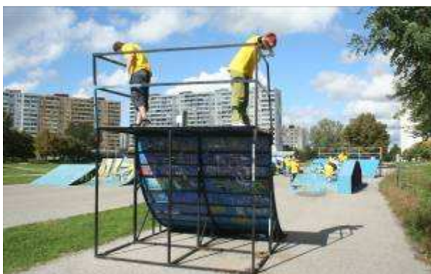
OZ Nová nádej Slovensko

Zóna aktívneho oddychu pri penzióne pre seniorov v Trenčíne