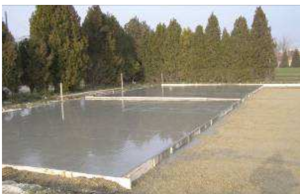
Gymnázium M.R.Štefánika a I. Madácha s VJM v Šamoríne

Obnovenie a rozšírenie spoločného športového areálu