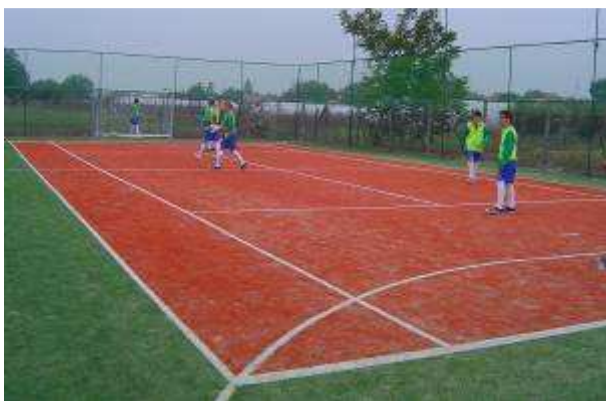
Základná škola s materskou školou s VJSaM Veľký Kýr