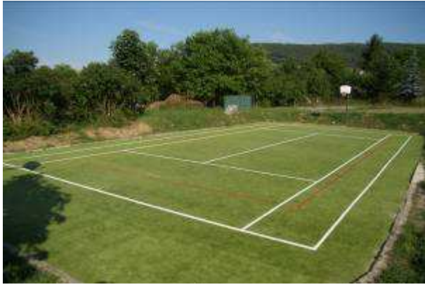
Základná škola Jedľové Kostoľany Multifunkčná hracia plocha