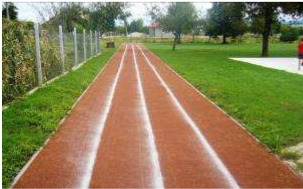
Základná škola s materskou školou Dvorec Školský športový areál