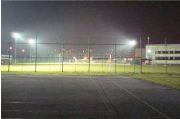
Saleziáni don Bosca