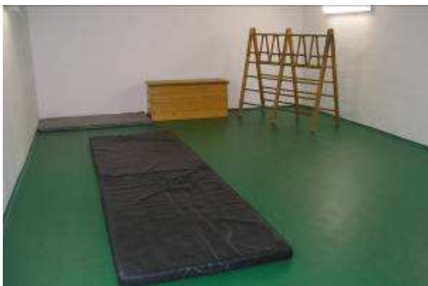
Obec Topoľnica Či v zime , či v lete cvičíme vesele...