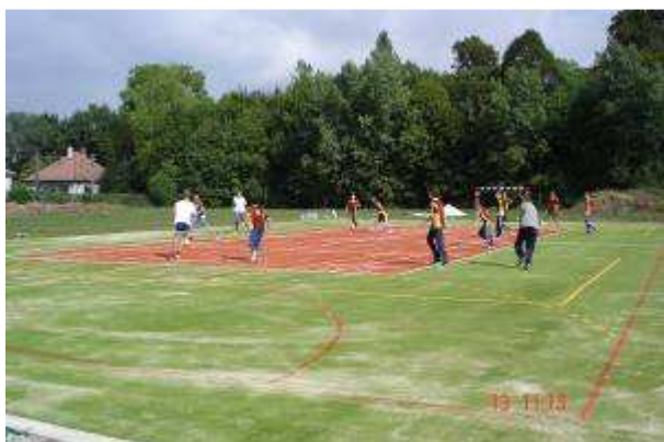
ZŠ s MŠ Moravany nad Váhom Multifunkčné ihrisko pre našu školu