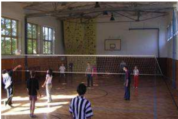
Základná škola Šaľa, Bernolákova ul. č. 1 Modernizácia školskej telocvične