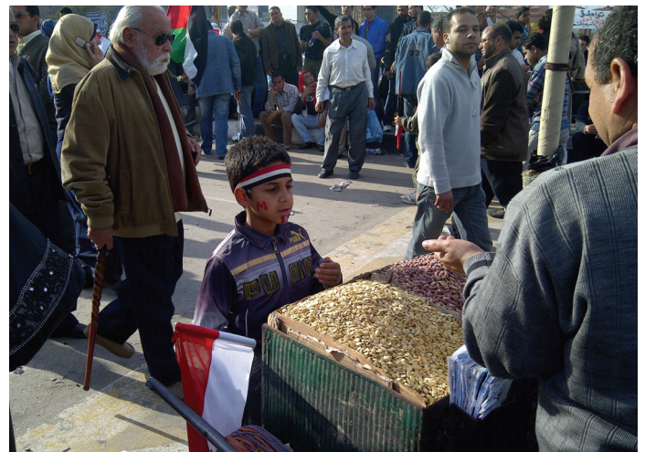
Ilustračné foto. Autor: Dalibor Roháč

Európska únia by sa mala angažovať v južnom susedstve za podporu reformných a liberalizačných krokov, ktorých dávkovanie by malo zohľadňovať jednotlivé absorpčné rozdiely a modalitu tej-ktorej arabskej spoločnosti. V tomto duchu je potrebné správne si nájsť skutočných arabských partnerov pre spoluprácu. Zároveň by sa mal zohľadňovať konečný cieľ zmien – slobodný a demokratický arabský svet, resp. región Blízkeho východu alebo aj Stredného východu. Pritom akýkoľvek reálny posun týmto smerom by sa mal pragmaticky a realisticky pozitívne hodnotiť. Akékoľvek ružové okuliare alebo snahy umelo urýchľovať sociálno-spoločenský a politický vývoj a preskakať jeho nevyhnutné etapy by sa mohli všetkým v Európe alebo v regióne Blízkeho a Stredného východu vypomstiť v strednodobom, ale najmä dlhodobom horizonte.