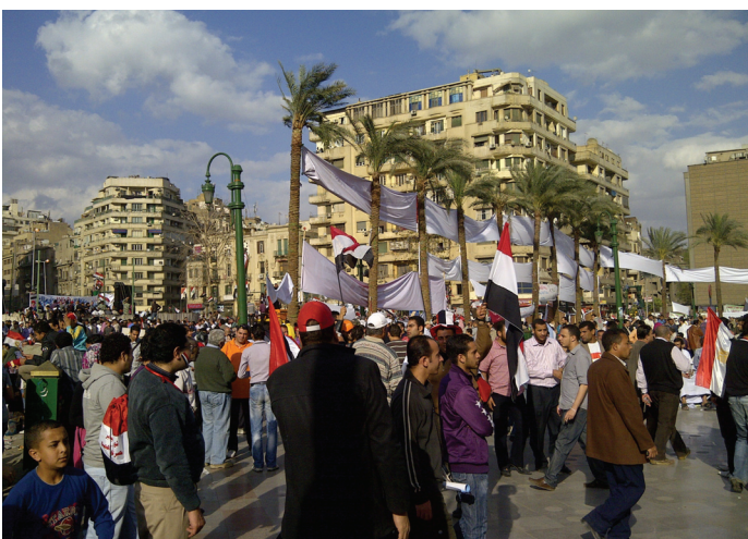
Ilustračné foto. Autor: Dalibor Roháč

Na scéně zůstal islamismus, který díky západní podpoře proti rostoucímu komunistickému vlivu v zemích třetího světa, vyšel ze studené války ještě silnější. Stal se, alespoň na chvíli, převládajícím světovým názorem schopným skutečně konkurovat existujícím pseudodemokratickým režimům. Ty právě těžily z islamistické hrozby, jak na domácí, tak i na mezinárodní scéně, zvláště s nástupem celosvětového boje proti terorismu. Díky tomu snadno získaly podporu svobodného světa, ale i jeho přehlížení soustavného porušování lidských práv a základních svobod v arabských státech.