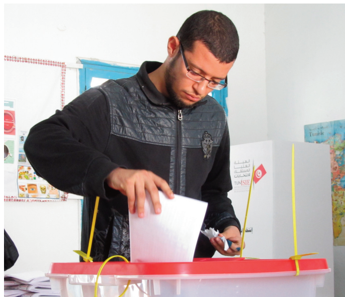
Volič vkladá svoj hlas do volebnej urny.

Už pred voľbami sa očakávala masívna volebná účasť a nekonečné rady pred volebnými okrskami v deň volieb tieto predpoklady len potvrdili. Pred jednotlivými okrskami sa už od rána tvorili zástupy ľudí, ktorí netrežlivo čakali, kedy sa dostanú na rad a odovzdajú hlas svojmu favoritovi. Keď k jednému z týchto okrskov dorazil líder umiernenej islamistickej strany an-Nahda (Strana obnovy) Rachid Ghannouchi, namieril si to rovno ku vchodu. Ľudia však začali ukazovať na koniec takmer kilometrovej fronty so slovami: „Demokracia sa začína tam vzadu!“ R. Ghannouchi, ktorý posledných 22 rokov strávil v exile vo Veľkej Británii, sa otočil a vystál si rad tak ako všetci ostatní. Nie je isté, či sa táto situácia odohrala presne takto, hoci ju mnoho Tunisianov na svojom blogu takto opisalo. Isté však je, že Rachid Ghannouchi a jeho strana sa stali víťazmi volieb.