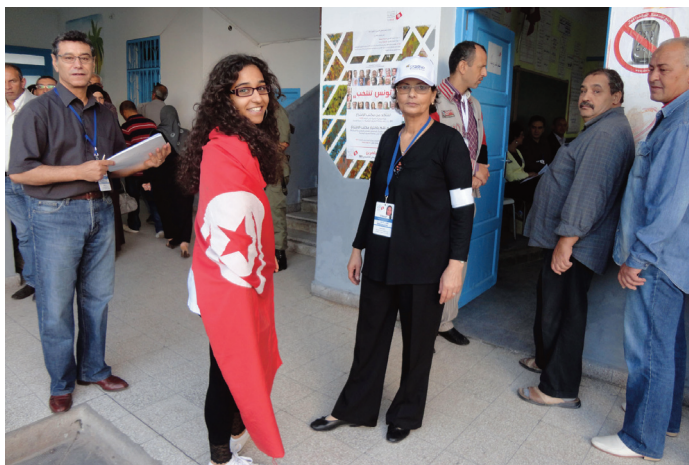
Pred volebnou miestnosťou v Tunise.

Aj napriek autoritatívnemu režimu bolo Tunisko v druhej polovici 20. storočia jednou z najliberálnejších krajín arabského a moslimského sveta. To však neznamená, že by v ňom islam nehral dôležitú rolu alebo že by ňom väčšina obyvateľov neboli moslimovia. Liberálnosť Tuniska súvisela skôr s charakterom režimu zakladateľa moderného Tuniska, prezidenta Habiba Bourguibyho a jeho nasledovníka Zine al-Abidína Ben Aliho. Obaja po určitých stránkach veľmi uvoľnili a sekularizovali pomery v krajine a obmedzili náboženské zvyklosti a vplyv náboženských autorít, napríklad obmedzením rodinnoprávných aspektov práva šaría (zákaz polygamie a niektorých praktík znerovnoprávnujúcich podľa šarie ženy) alebo obmedzením nosenia náboženských symbolov (ako napr. ženských šatiek v štátnych inštitúciách) a podobne. Situácia na poli politických slobôd a ľudských práv však bola za vlády tuniských autokratov podstatne horšia. Napríklad podľa indexu demokracie týždenníka Economist z roku 2010 bolo (stále ešte benaliovské) Tunisko hlboko na konci tabuľky medzi autoritatívnymi režimami (144. miesto zo 167 analyzovaných krajín).