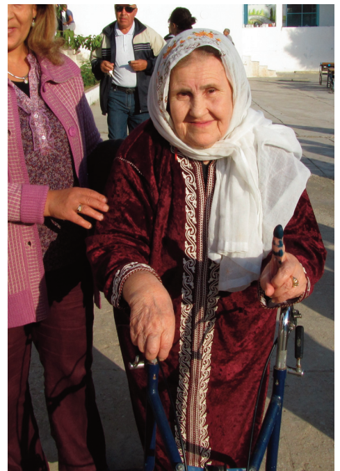
Podľa moslimskej tradície existujú tri druhy pokrývkov hlavy. Hidžáb je šatka zakrývajúca vlasy. Burka je maska, ktorá sa nosí k hidžábu a skrýva dolnú časť tváre, ale nie oči. Nikáb zakrýva celú hlavu aj s tvárou.

Autorka: Jana Shemesh je zahraničnou dopisovateľkou denníka SME a časopisu Týždeň pre oblasť Blízkeho východu. Žije v Izraeli.