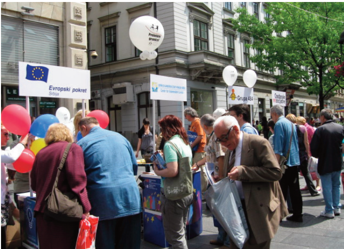
Srbské mimovládne organizácie v uliciach Belehradu pri príležitosti osláv Dňa Európy.

Organizácie občianskej spoločnosti sú v súčasnosti v Srbsku dobre vyvinuté a zohrávajú dôležitú úlohu v sociálnom, hospodárskom a politickom živote v Srbsku. Aj napriek tomu je vzťah medzi vládou a týmito organizáciami stále poznačený fragmentovanou spoluprácou. Hoci vláda začala uznávať význam občianskej spoločnosti v procese európskej integrácie, občianska spoločnosť v Srbsku je stále podceňovaná. Aj keď už nie je potlačovaná ako v 90. rokoch, stále jej chýba uznávaná úloha, pričom jej vplyv na riadiace procesy a na kľúčové politické a sociálne otázky je do značnej miery nepotvrdený. Na lokálnej úrovni je situácia ešte horšia, odkedy oba mechanizmy pre spoluprácu s organizáciami občianskej spoločnosti a praxou zostávajú chudobné. Avšak pokiaľ ide o európsky integračný proces, existuje niekoľko dobrých príkladov rôznych foriem konzultácií a spolupráce medzi organizáciami občianskej spoločnosti a Národným parlamentom či jednotlivými vládnymi orgánmi. V roku 2005 podpísali predstavitelia Srbského úradu pre európsku integráciu s približne tridsiatimi mimovládnyimi organizáciami v Srbsku Memorandum o spolupráci v procese európskej integrácie. Toto memorandum predstavuje prvé memorandum tohto druhu podpísané medzi vládnym a mimovládnym sektorom.