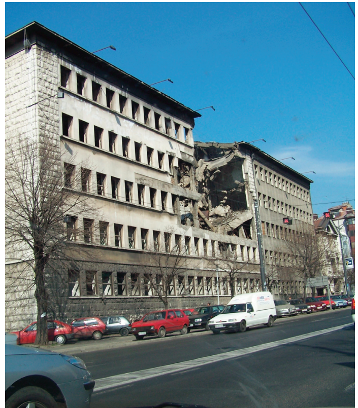
Budova v uliciach Belehradu zbombardovaná v roku 1999.