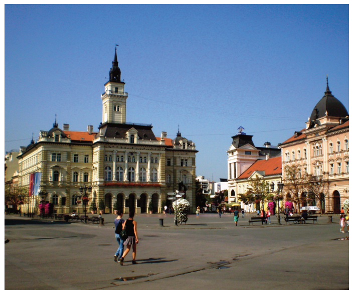
Popularita vstupu Srbska do Európskej únie u srbského obyvateľstva postupne klesá.

Európska komisia vydala v októbri dlho očakávanú priebežnú hodnotiacu správu o pokroku , ktorá by mala napovedať, aká bude budúcnosť prístupov-