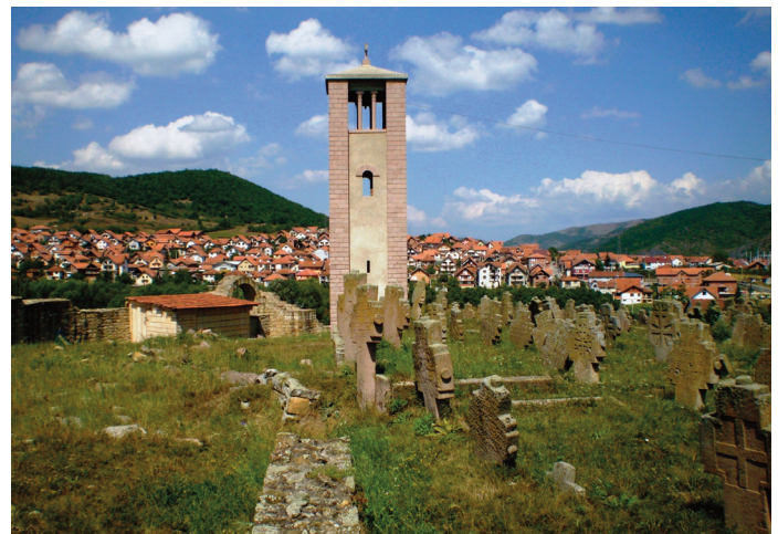
Cintorin pri kostole Sv. Petra v Novom Pazare.

Pozitívne nastavenie srbskej spoločnosti i politickej reprezentácie voči Slovensku vytvára do istej miery i fakt, že Slovensko dosiaľ neuznalo jednostranné vyhlásenie nezávislosti Kosova a podporuje riešenie tzv. kosovskej otázky prostredníctvom kontinuálneho dialógu medzi Belehradom a Prištinou. Hoci nemožno tento faktor preceňovať, v kombinácii s hore uvedenými aspektmi vytvára priaznivý priestor pre pôsobenie Slovenska v Srbsku.