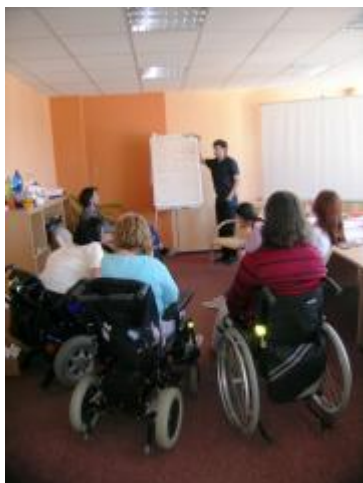
Vzdelávacie a osvetové aktivity Agentúry osobnej asistencie v Žiline

Každé dieťa/aj dospelý má zo zákona nárok na bezplatnú zdravotnú starostlivosť. Ide však o základnú liečbu, ktorá ide ruka v ruku so zakupovaním potrebných vitamínov, či iných doplnkov liečby, ktoré sú ekonomicky náročné. O to viac, že jeden z rodičov automaticky prichádza o stály príjem, pretože je žiaduce, aby bol s dieťaťom v nemocnici. Z roka na rok sú doplatky za lieky vyššie, preto ich Svetielko nádeje rodinám prepláca. Prostriedky z grantu boli poskytnuté rodinám na úhradu doplatkov za lieky.