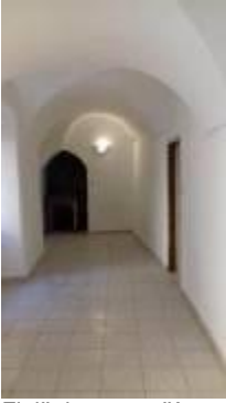
Finišujeme a tešíme sa z prvých výsledkov