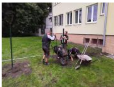
ADI_ZGP19_04 , Obec Blatnica Oddychová zóna pre deti , Výška podpory: 3 000,00 € Zapojený zamestnanec: Vladimír Froľa

https://www.facebook.com/trencianskyyterajsok/videos/2426617910903491/