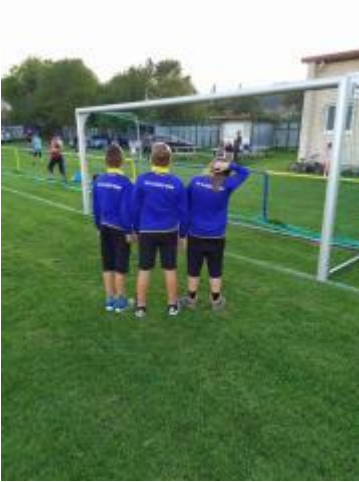
foto časti družstva U13

motivovali k lepším výsledkom, väčšej motivácii, lepšej nálade. Deti sa viac tešili na cvičenie, ktoré viedli certifikovaní terapeuti.