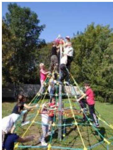
Detské ihrisko s osadenou lanovou pyramídou

Projekt "Cesta rozprávkovou krajinou" sa realizoval 1.6.2018 vo vonkajších priestoroch MŠ. 94 detí plnili počas projektu úlohy na elementárnej úrovni s pomocou pedagogických zamestnancov. Na jednotlivých stanoviskách im úlohy predkladali rozprávkové postavy. Deti prezentovali ich plnením všetky nadobudnuté vedomosti, poznatky. Všetky deti v uvedený deň prežili skvelú zábavu, veľa radosti a mali pocit úspechu v nájdení pokladu. Realizácia projektu vo významnej miere prispela k prežívaniu detskej radosti počas dňa, keď mali všetky deti sviatok: "Deň detí". V uvedený deň prispelo k úspechu projektu aj priaznivé počasie.