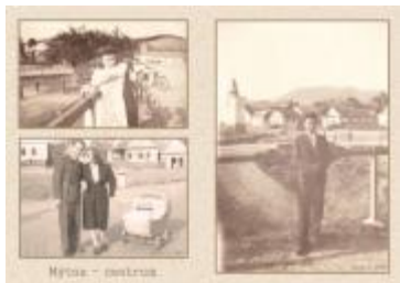
Ukážka fotografie formát A1, ktoré budú inštalované na výstave

V začiatkovej fáze projektu sme zabetónovali pätky, osadili drevenú konštrukciu. Vo finálnej fáze sme namontovali tieniace plachty a rolety. Udelený grant prispel k tomu, aby deti z MŠ Mýtňa mohli tráviť viac času na čerstvom vzduchu i v horúcich letných dňoch, čo by bez zatienenia pieskoviska nebolo možné. Prostriedky získané z grantu sme využili na zakúpenie tieniacich plachiet a roliet.