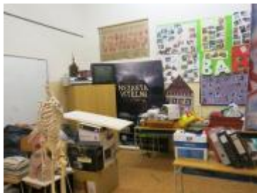
Priestory pred rekonštrukciou