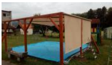
Zrealizovaný projekt zatienenia pieskoviska

ADI_ZGP_24 , Občianske združenie Mýtňanček Zatienenie pieskoviska , Výška podpory: 500,00 € Zapojený zamestnanec: Maroš Koristek