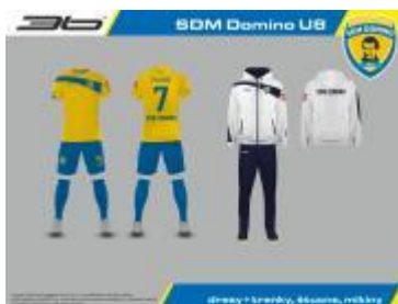
Grafický návrh dresov.

ADI_ZGP_16, SDM DOMINO Budujeme spoločne jeden klub, Výška podpory: 800,00 € Zapojený zamestnanec: Rastislav Ďurovič