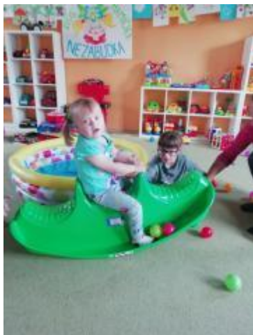
Naši klienti sa tešia z nových hračiek a nového zariadenia klubu

Vďaka projektu sme v našej organizácii mohli zakúpiť stroj na výrobu magnetiek, ktorý rozvíja pracovné zručnosti u ľudí so zdravotným postihnutím. Stroj sa jednoducho ovláda, preto s ním ľahko a bezpečne môžu pracovať aj ľudia s mentálnym postihnutím. Pre týchto ľudí predstavuje táto forma pracovnej terapie obrovský význam, keďže sa veľmi ťažko zaraďujú do pracovného života. Zariadenie a materiál využívame na získavanie zručností a vydarené výrobky používame na prezentáciu našej organizácie a práce našich zdravotne postihnutých klientov.