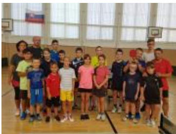
Fotky zo stolnotenisového a futbalového campu

ADI_ZGP_32, Základná škola s materskou školou Kalinovo Podpora a rozvoj telesnej kultúry, Výška podpory: 1 000,00 € Zapojený zamestnanec: Lucia Mázová