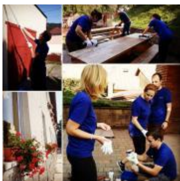
Realizácia aktivít projektu

Prostriedky sme použili na stavbu altánku pre deti materskej a základnej školy vo Fige. Altánok prispeje k zlepšeniu vyučovacieho procesu a umožní vyučovať deti v prírode.