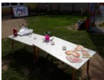
Deti plnili úlohy na školskom dvore.

V projekte sa prostredníctvom troch cyklov neformálneho vzdelávania a tvorivých dielní navzájom učili prijímatelia sociálnych služieb, zamestnanci DSS Slatinka a pracovníci firmy Adient Slovakia s.r.o. odštepny závod Lučenec. V prvom cykle, ktorý bol zameraný na ochranu životného prostredia vytvorili bylinkovú oázu, pripravili ukážky premeny starých vecí na nové a v tvorivej dielni si vyskúšali ako sa dajú veci recyklovať. V druhom cykle, ktorého cieľom bolo podporiť zachovanie ľudových remesiel, sa naučili ako sa dajú spracovávať včelie produkty a vyskúšali si odlievanie sviečok z včelieho vosku. V treťom cykle hovorili o ľudských právach a vytvorili spoločnú mandalu.