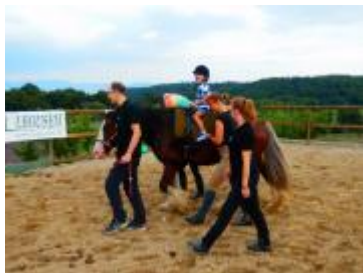
Zamestnanci firmy Adient asistujú svojou dobrovoľnou činnosťou pri hipoterapii.

Projekt Klub mamičiek Nezábudka prispel k naplneniu uvedeného cieľa. Nákup hračiek, ktoré podporujú zlepšovanie motoriky a fyzických zručností detí do 3 rokov veku a detí s poruchou autistického spektra (magnetická kniha na určovanie geometrických tvarov a zvierat, pomôcky na triedenie farieb a učenie sa základov počítania, pexeso na zlepšovanie hmatového zmyslu, jednoduché hračky na rozvoj hry detí...) tiež zariadenia do herne (čistička vzduchu a mikrosystém na púšťanie hudby) prispeli k zlepšeniu kvality pobytu našich klientov v Klube mamičiek Nezábudka.