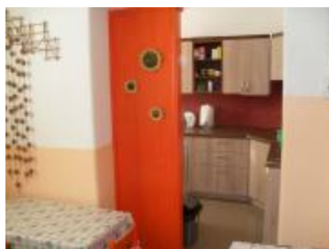
Nová hotová prerobená kuchyňa s jedálňou

Materská škola sv. Uršule existuje už 6 rokov. V septembri 2016 sa spojila so základnou školou, ktorá sídli v tej istej budove. Vzhľadom na veľký záujem zo strany rodičov sa zriaďovateľ rozhodol rozšíriť kapacitu materskej školy z 3 na 4 triedy. Aby to bolo možné, bolo potrebné zrekonštruovať niektoré priestory školy a toalety a následne ich upraviť a vybaviť potrebným zariadením. Podarilo sa nám to zrealizovať aj s pomocou Nadačného fondu Adient a finančné prostriedky z dotácie sme použili na kúpu skriniek.