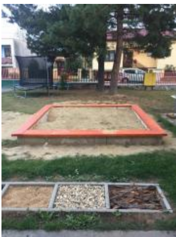
Detské pieskovisko, skákačky a chodník zdravia.

Projekt predstavoval dobrovoľnícku a finančnú pomoc pri rekonštrukcii priestoru pre terapeutické kone v organizácii Jazdecko-rehabilitačné centrum Lesan n. o. Hipoterapeutické kone v rámci starostlivosti v duchu welfare potrebujú priestor pre voľný pohyb v čase kedy neprebíha hipoterapia. Išlo o opravu oplotenia, aby spĺňalo bezpečnostné a technické parametre. Oprava bola spojená so stretnutím a jazdením detí dobrovoľníckej skupiny zo spoločnosti Adient, občerstvením a opekačkou. Aktivita dobrovoľníkov bola výnimočná a ťažkú prácu s kladivami a nosením dosiek zvládli výborne. Náklady súviseli so zabezpečením materiálu- drevené dosky, stĺpy, klince, kladivá a podobne.