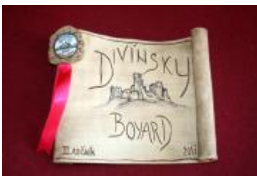
Výber fotografií z III. ročníka súťaže DIVÍNSKY BOYARD 2017

Vďaka finančným prostriedkom, ktoré sme získali cez tento grant sa nám podarilo zakúpiť dva dataprojektory do našej školy. Keďže sa už rozbehol nový školský rok, slúžia nám na skvalitnenie výchovno-vzdelávacieho procesu. Žiaci sa učia nielen tak, že počúvajú vyučujúceho, ale ich výuka môže byť spretrená vizualizáciou, videami, prezentáciami s textom alebo obrázkami. Cvičenia im môžeme premietnuť na stenu, takže ušetríme na kopírovaní materiálov pre žiakov. Veríme, že nám zakúpené pomôcky budú slúžiť niekoľko rokov.