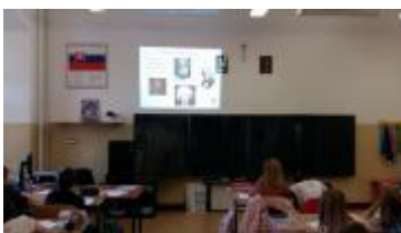
Fotky zo 6.A triedy.

Projekt bol realizovaný v mesiaci júl 2018 za účelom skvalitnenia TV vybavenia - športových doplnkov materskej školy. Využitím finančných prostriedkov projektu sme zakúpili a umiestnili záhradné športové doplnky na ihrisko - hojdačky pre deti v počte 2 ks. Vďaka grantu sme dosiahli spokojnosť detí v oblasti pohybu a športu a zvýšenie ich pohybovej zdatnosti.